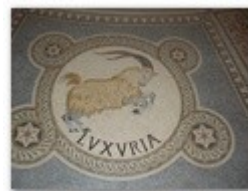
3. la luxure