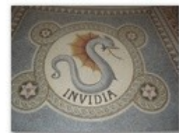
4. l'envie et la jalousie