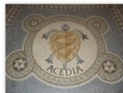
7. la paresse

En remontant vers l'esplanade, l'escalier est bordé par un bénitier en calcaire rouge de Flacé-les-Macon.