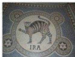
6. la colère