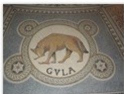
5. la gourmandise