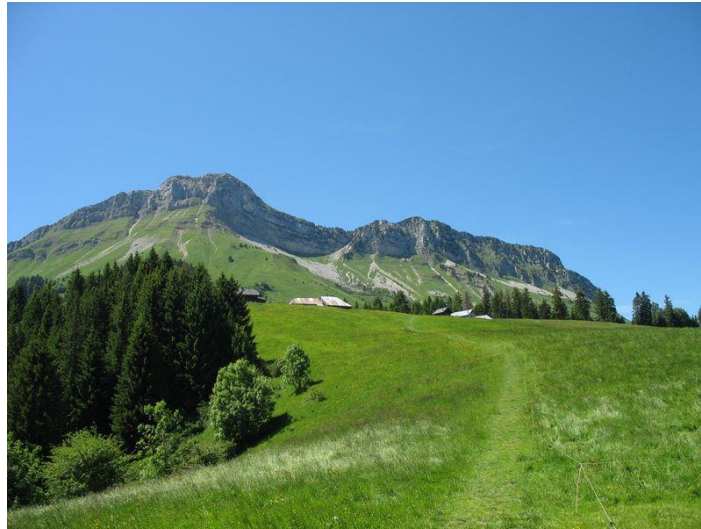
Chalets de la Fullie et Colombier

Le Mont Colombier dans les Bauges est plus élevé que le Grand Colombier (1531m) au Sud du Jura. Lui aussi peut être appelé « Grand Colombier » ou « Colombier d'Aillon »